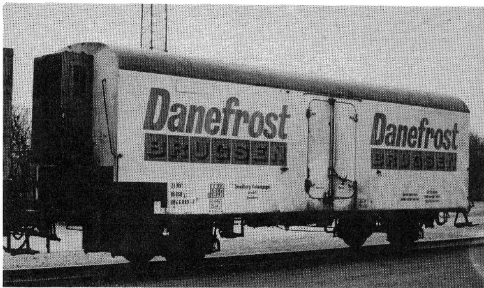
084 4 000-2 med de nederste påskrifter ændret samt u/bremsehjørner og u/RIV'-mærke og DSB på vognkassens højre side.

IGENNEM ÅRENE HAR DISSE VOGNE KØRT I FAST RU-