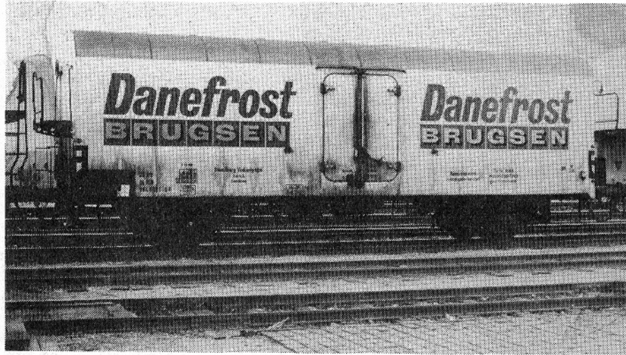
DANEFROST 21 86 084 001-0 i det oprindelige udseende.

VOGNEJER: SVENDBORG VINKOMPAGNI A.M.B.A. VOGNTYPE: MASKINKØLEVOGN. LITRA: 21 86 084 4 001-0 BYGGET AF: SCANDIA I 1954 - BYGGENUMMER 20928. LAST: 16300 KG - TARA. LÆNGDE OVER PUFFER: (-12,10M-) AKSELAFSTAND: -> 6,60M<- RUMINDHOLD: 46,2 KUBIKM. BUNDFLADE: 22,1 KVM. DØRBREDDER: 1,40M. - HØJDE: 1,94M. VOGNKASSEBREDDE: 2,76 M. -||- HØJDE: 4,048 M. - U/ROTORER. BREMSESYSTEM: RS (MAN.) OG HIK-GP (AUT.). HJEMSTED: SVENDBORG. *) VÆRKSTEDSOMRÅDE: NYBORG.