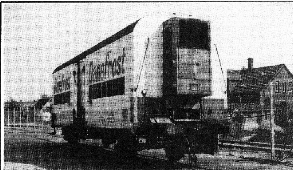
Kølemaskinen på 084 001-0. Tv. for kølemaskinen sidder et termometer til aflæsning af temperaturen inde i vognen.